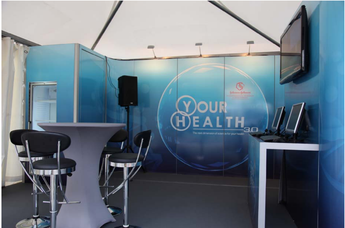
Voorbeeld gepersonaliseerde achterwand(en)