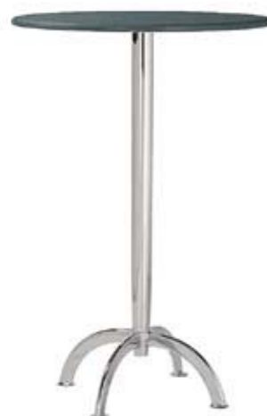
Statafel (Ø 80cm, hoogte 116cm)