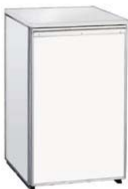
Koelkast (140 liter)