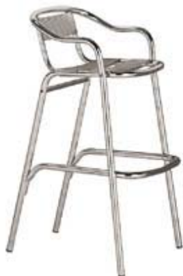
Barkruk (zithoogte 73cm)