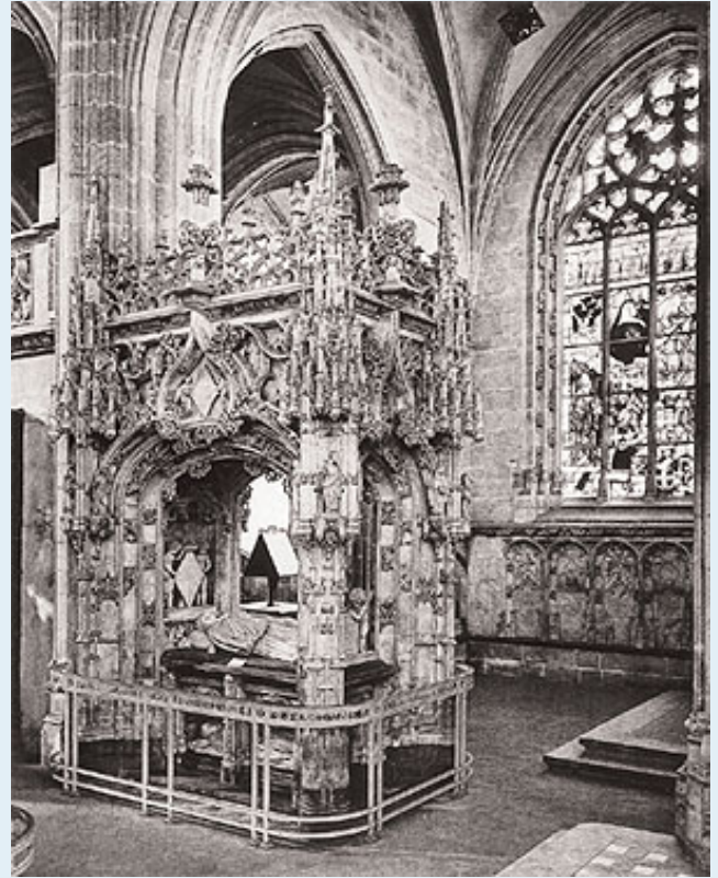
Lodewijk van Boghem en Conrad Meit, Baldakijngraf Margareta van Oostenrijk, Brou