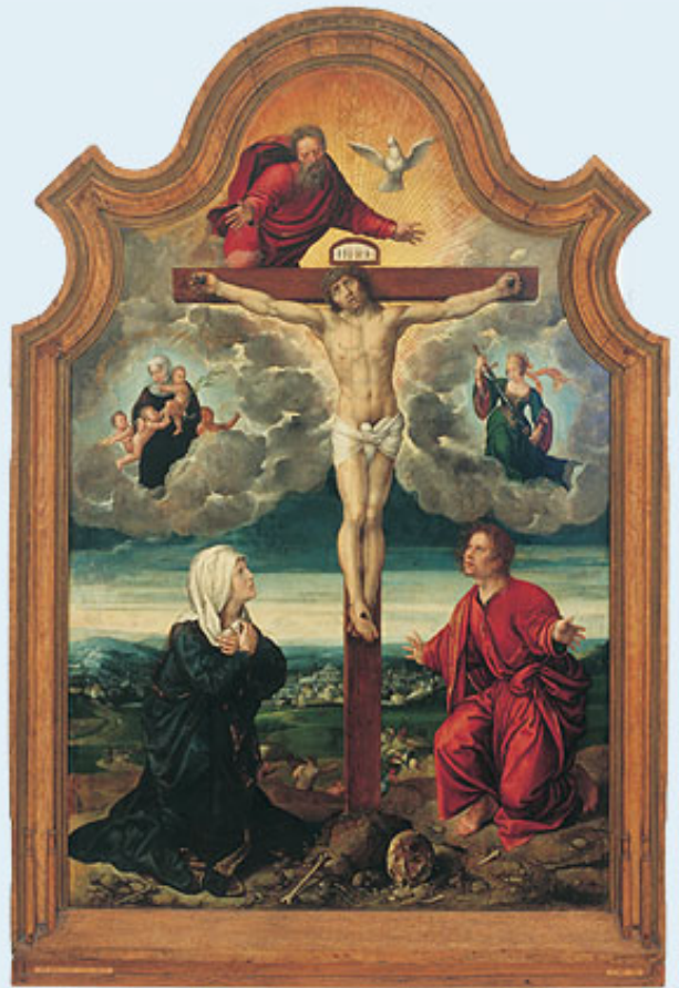
Bernard van Orley, Kruisiging, ca. 1523-24

Kijk eens goed naar dit schilderij. Mijn hofschilder beeldt de traditionele kruisigingsfiguren af: Christus, Maria en Johannes; daarboven zie je nog God de Vader en de Heilige Geest. Als je goed kijkt zie je in de wolkenpartijen nog twee dames. Herken je mij? Waar en waaraan? Ik ben afgebeeld als een goede en strenge moeder van het land, zoals ik ook pleegmoeder van mijn neefjes en nichtjes ben geweest.