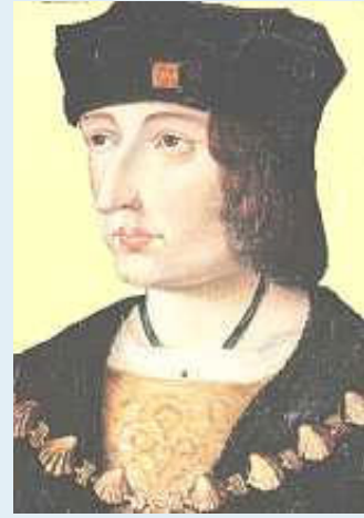
Portret Karel VIII van Frankrijk

In het slot van Amboise aan de Loire ontmoet ik eindelijk mijn echtgenoot, Karel! Als zijn vader sterft, wordt ik koningin van Frankrijk. Mijn man is nu koning Karel VIII; omdat hij zo jong is, wordt zijn zus regentes. Als drie-jarige ben ik la petite royne (de kleine koningin)! Mijn min mag bij me blijven en ik krijg een gouvernante om me op te voeden. Weet je wat een min is?