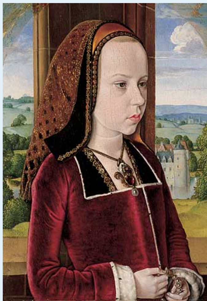
Jean HEY, Margareta van Oostenrijk, 1490-91

Ik ben geen kind meer! Aan het Franse hof in Amboise ben ik opengebloeid tot een jonge dame van 11 met een verfijnde opvoeding: mijn kennis van het Frans is prima, ik heb Latijn geleerd, tekenen, schilderen, borduren, zingen en musiceren ... en de typische hofdanses. Mijn koninklijke echtgenoot houdt dolveel van me: hij laat een officieel portret van mij schilderen en geeft me schitterende cadeau's.