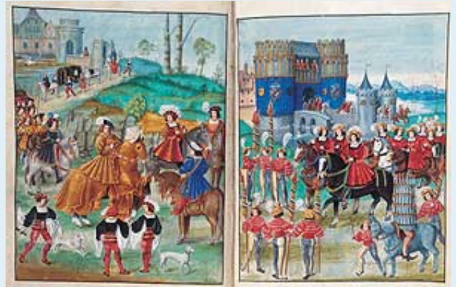
Blijde Inkomst Karel in Brugge, 1515

Als Karel bijna 15 is, neemt hij het bestuur van de Nederlanden over. Ik ben dan regentes af.