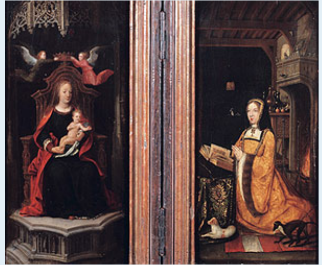
Diptiek met Margareta van Oostenrijk in verering voor Maria met het Kind

Het schilderij zegt dus ook iets over mijn politieke rol in Savoye. Leg eens uit.