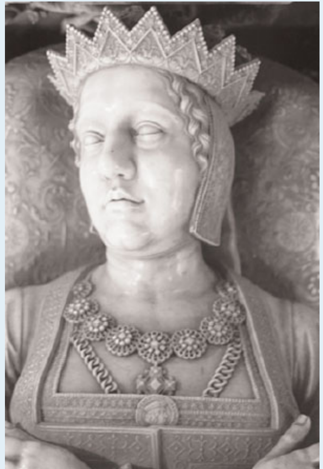
Conrad Meit, Margareta van Oostenrijk, Brou