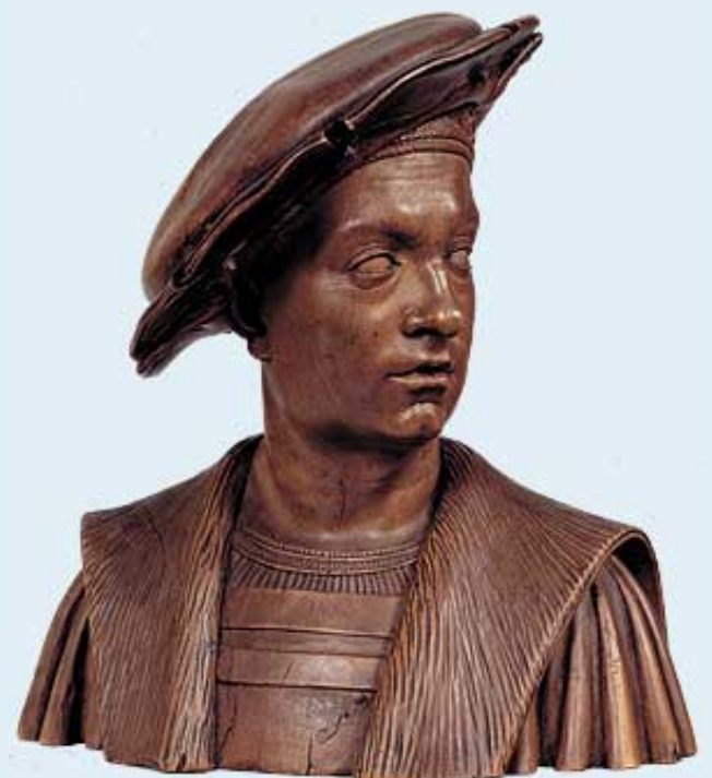
Conrat Meit, Portretbuste Philibert II van Savoye

Het huwelijk vindt plaats eind 1501. We kunnen het uitstekend met elkaar vinden. Omdat Philibert weinig interesse voor politiek heeft, laat hij de staatszaken aan mij over. Dat ligt me prima! Mijn hofhistoriograaf noemt mij 'de eerste minister van mijn man'. Het traditionele rollenpatroon zet ik dus op de helling!